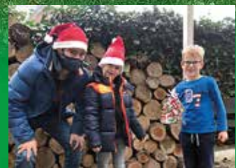
Überraschung Nr. 3 ...für die „Kleinsten“ des Vereins