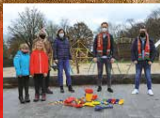
Überraschung Nr. 2 ...für die Kitas in Bookholt