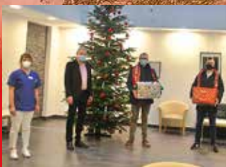
Überraschung Nr. 1 ...für die Pflegeheime in Bookholt