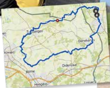
Tour der Rennradgruppe