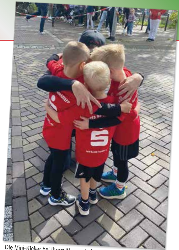
Die Mini-Kicker bei Ihrem Mannschaftsritual vor dem Lauf.

Als Belohnung gab es jeweils eine Sparta-Medaille und eine Urkunde. In Ihren roten Sparta Training Shirts haben die Jungs unseren Verein optimal präsentiert.