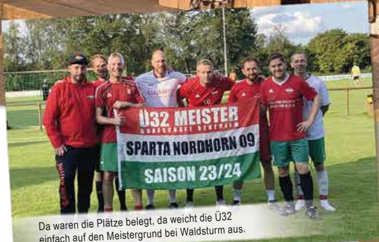
Da waren die Plätze belegt, da weicht die Ü32 einfach auf den Meistergrund bei Waldsturm aus.